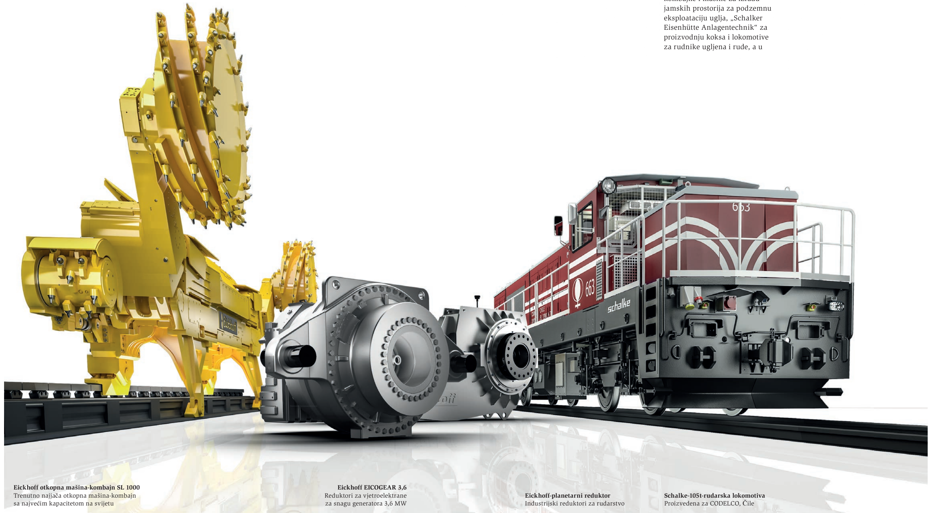
Eickhoff otkopna mašina-kombajn SL 1000 Trenutno najjača otkopna mašina-kombajn sa najvećim kapacitetom na svijetu

međuvremenu i hibridne lokomotive za podzemne željeznice. „Eickhoff Maschinenfabrik“ je razvio važno tržište sa reductorima za vjetroelektrane. Za sve segmente naše grupe Eickhoff ljevaonica razvija nove materijale kao i postupke, kako bi se zadovoljilo sve većim zahtjevima za savremenim vrstama materijala.